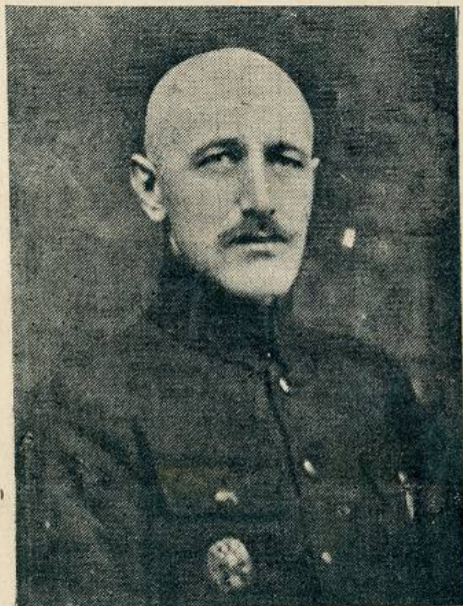
Ген. ВСЕВОЛОД ПЕТРІВ

Очевидець наших визвольних змагань дає картину подій, що хвилюють більше як сензаційна повість.