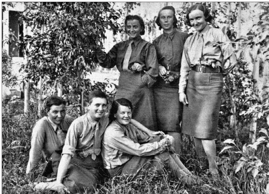
Żołnierki plutonu wartowniczego WP. Teheran 2 maja 1942 r.

Zaraz po tym dostałyśmy po dwie zmiany bielizny i umundurowanie, również angielskie. Później rozmieścili nas w jakichś koszarach w Teheranie i przez kilka dni był wypoczynek. W międzyczasie przyjechała żona ambasadora, czy konsula angielskiego, by zobaczyć polskie ochotniczki.