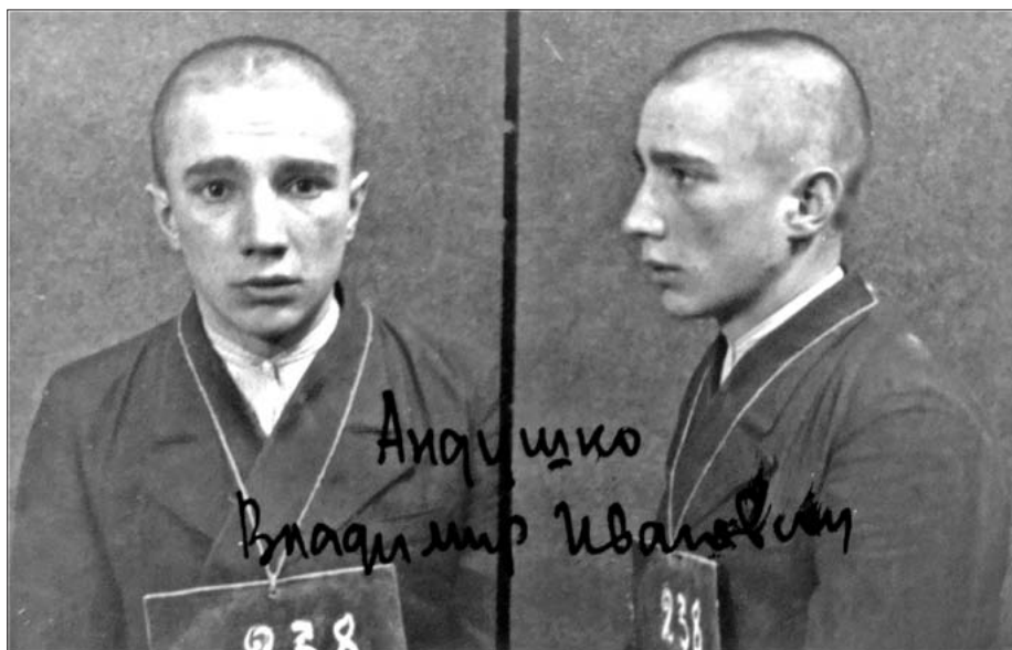
Fotografie więzienne Włodzimierza Andruszki

4 Jakow Winokur (1909-1941) – w 1936 funkcjonariusz Centralnego aparatu UGB NKWD USRR. Od maja 1940 starszy lejtnant bezpieczeństwa państwowego, naczelnik Dubieńskiego Oddziału Rejonowego Zarządu NKWD. Zginął na froncie w 1941. Zob. Wołyń za „pierwszych Sowietów”... , t. I, s. 58, 66, 126.